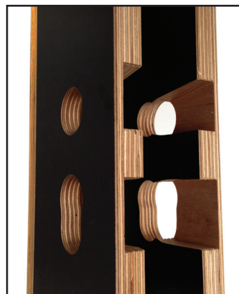
afb. 3 - Uitsparingen voor afvoer van houtkrullen

Voor een overzicht van beschikbare slotkast freesmallen. Kijk dan op onze website: www.riens.nl