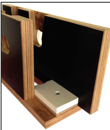
afb. 2 - Opvulling voor aanpassen van de doornmaat