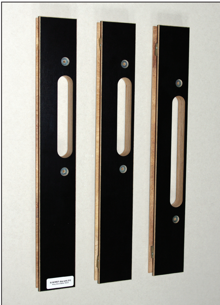
afb. 1 - Onderdelen van de freesmal - 2x bijzetkom, 1x hoofdkom

Onderdelen van deze mal zijn los te verkrijgen, daardoor kunt u simpel een kapot onderdeel vervangen.